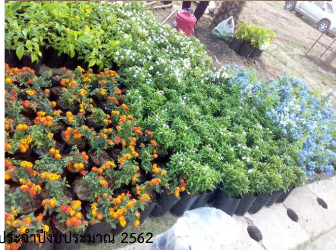
แบบรายงานผลการดำเนินงานประจำปีงบประมาณ 2562