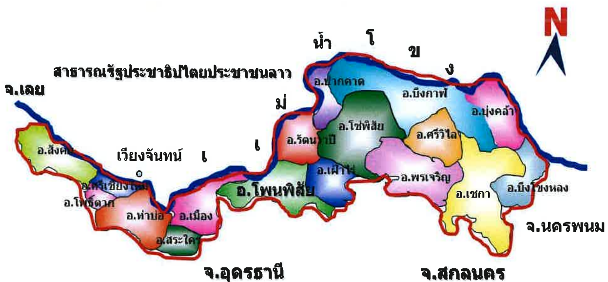
รูปภาพที่ ๒ แสดงที่ตั้งและอาณาเขต จังหวัดหนองคาย

สภาพภูมิประเทศของจังหวัดหนองคายมีลักษณะทอดยาวตามลำน้ำโขง จังหวัดหนองคาย เป็นจังหวัดชายแดนทางภาคตะวันออกเฉียงเหนือตอนบน มีอาณาเขตติดกับกรุงเวียงจันทน์ ซึ่งเป็นเมืองหลวงของประเทศสาธารณรัฐประชาธิปไตยประชาชนลาว โดยมี แม่น้ำโขง เป็นเส้นกั้นเขตแดน จังหวัดหนองคายเป็นจังหวัดชายแดนที่มีเอกลักษณ์พิเศษโดยมีพื้นที่ทอดขนานยาวไปตามลำน้ำโขง ความกว้างของพื้นที่ทอดขนานไปตามลำน้ำโขงโดยเฉลี่ยประมาณ ๒๐ - ๒๕ กิโลเมตร ช่วงที่กว้างที่สุดอยู่ที่ อำเภอเฝ้าไร่ และช่วงที่แคบที่สุดอยู่ที่จังหวัดหนองคาย มีอำเภอที่อยู่ติดกับลำน้ำโขง ๖ อำเภอ คือ อำเภอสังคม อำเภอท่าบ่อ อำเภอศรีเชียงใหม่ อำเภอเมืองหนองคาย อำเภอโพนพิสัย และอำเภอรันทวาปี และมีอาณาเขตติดต่อกับประเทศสาธารณรัฐประชาธิปไตยประชาชนลาว คือ แขวงเวียงจันทน์ นครหลวงเวียงจันทน์ และแขวงบอลิคำไซ