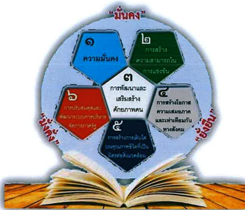
รูปที่ ๑ กรอบยุทธศาสตร์ชาติระยะ ๒๐ ปี (พ.ศ. ๒๕๖๑ - ๒๕๘๐)

“แผนปฏิบัติการประจำปีงบประมาณ พ.ศ. ๒๕๖๕ สำนักงานเขตพื้นที่การศึกษาประถมศึกษาหนองคาย เขต ๒” จัดทำขึ้น เพื่อเป็นเครื่องมือในการบริหารการศึกษาขั้นพื้นฐานให้มีประสิทธิภาพ โดยได้จัดประชุมเชิงปฏิบัติการ เพื่อระดมความคิดจากผู้มีส่วนเกี่ยวข้องในการจัดการศึกษา ประกอบด้วย คณะกรรมการติดตามตรวจสอบประเมินผลและนิเทศการศึกษา ผู้บริหารการศึกษา ผู้บริหารสถานศึกษา ผู้อำนวยการกลุ่มทุกกลุ่ม/หน่วยตรวจสอบภายในและเจ้าหน้าที่ที่เกี่ยวข้อง ในสังกัดสำนักงานเขตพื้นที่การศึกษาประถมศึกษาหนองคาย เขต ๒ ซึ่งร่วมกันวิเคราะห์สภาพแวดล้อมทั้งภายในและภายนอก โดยใช้เทคนิค SWOT Analysis และแนวทางการบริหารประเทศของรัฐบาล ตามวิสัยทัศน์ “มั่นคง มั่งคั่ง ยั่งยืน” พลเอกประยุทธ์ จันทร์โอชา นายกรัฐมนตรี