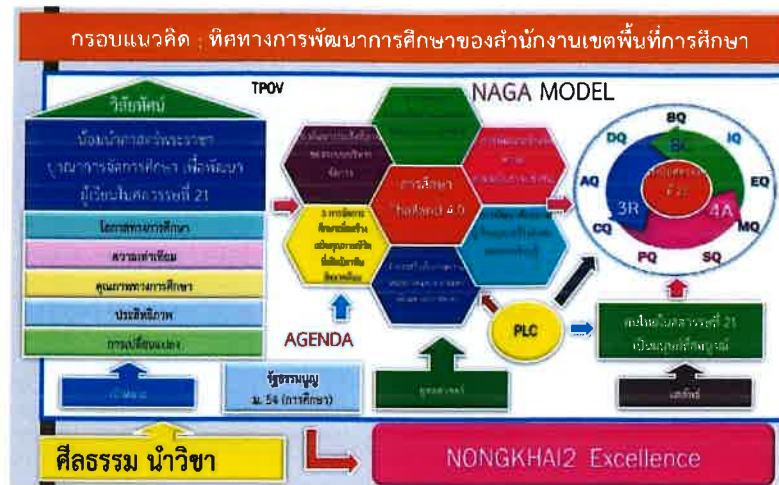
รูปภาพ ทิศทางการพัฒนาคุณภาพการศึกษาตามแนวคิด“NAGA MODEL”