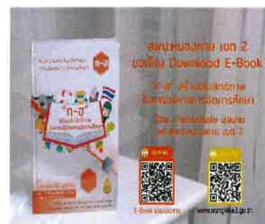
ภาพที่ ๑๑ แนวความคิดกับนวัตกรรมการบริหารจัดการศึกษาก-ฮ

จากแนวคิดนี้ จะได้จัดทำแบบประเมินประสิทธิภาพในการเป็นผู้บริหาร ตามแนวคิดเชิงนวัตกรรม ก - ฮ ของผู้บริหารสถานศึกษาในสังกัดสำนักงานเขตพื้นที่การศึกษาประถมศึกษาหนองคาย เขต ๒ เพื่อจัดอันดับคุณภาพตามแนวคิด ก - ฮ และรับรู้สภาพจริงปัจจุบัน ก่อนกำหนดสภาพอันพึงประสงค์ในอนาคต เพื่อส่งเสริม สนับสนุน การบริหารจัดการศึกษาให้มีประสิทธิภาพ และประสิทธิผลในทุกมิติตามลำดับ