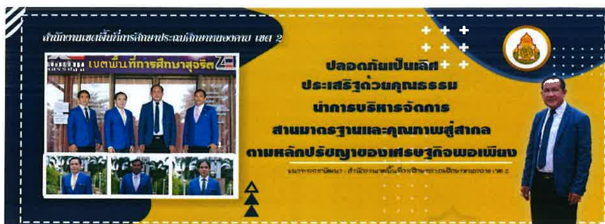
รูปภาพ ทิศทางการพัฒนาการศึกษาของสำนักงานเขตพื้นที่การศึกษาประถมศึกษาหนองคาย เขต ๒

แนวทางการพัฒนา “ปลอดภัยเป็นเลิศ ประเสริฐด้วยคุณธรรม นำการบริหารจัดการ สานมาตรฐานและคุณภาพสู่สากล ตามหลักปรัชญาของเศรษฐกิจพอเพียง”