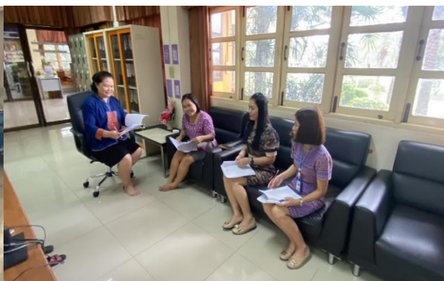
การนิเทศตัวชี้วัดของกลุ่มงานนโยบายและแผน