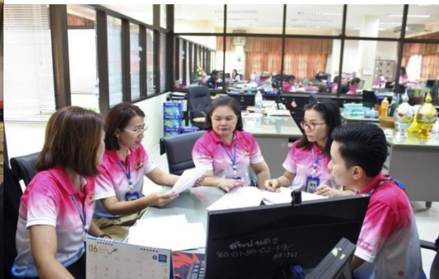
การนิเทศตัวชี้วัดของกลุ่มงานอำนวยการ