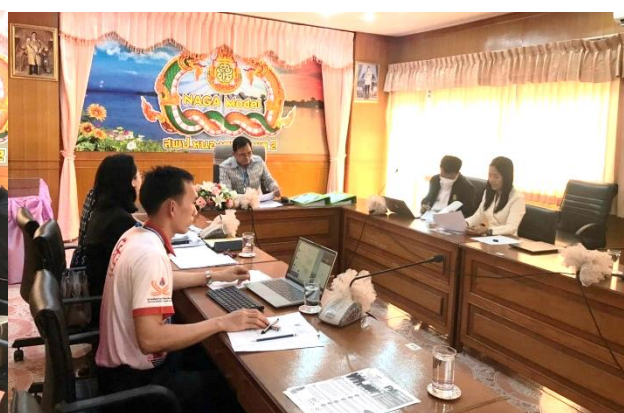
การนิเทศตัวชี้วัดของกลุ่มบริหารงานบุคคล