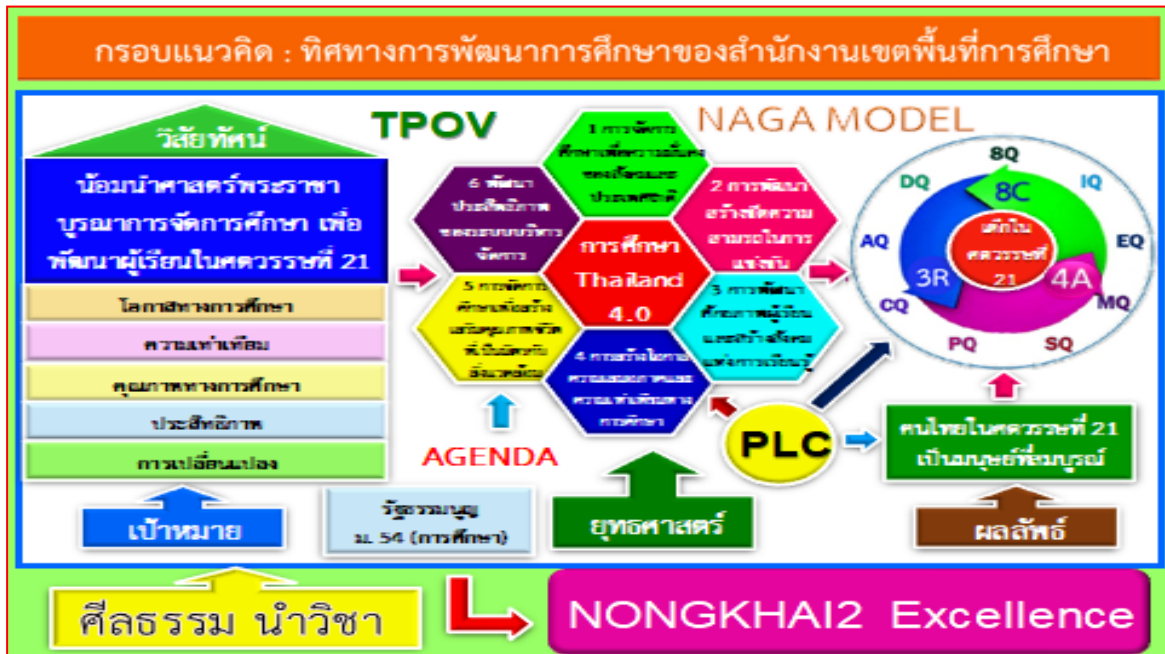
แผนภูมิที่ 4 กรอบแนวคิด : ทิศทางการพัฒนาการศึกษาของสำนักงานเขตพื้นที่การศึกษา